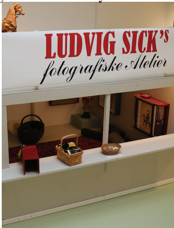
Ludvig Sick's fotografiske Atelier