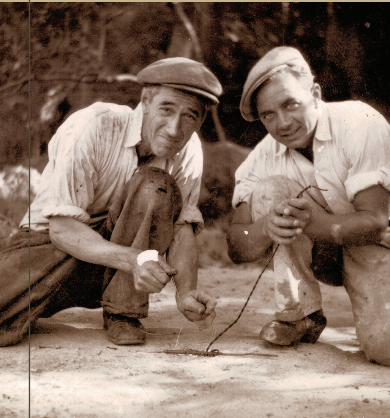
Foto: Fra årets særudstilling "KLIK - Historiske fotografier fra Vestfyn"