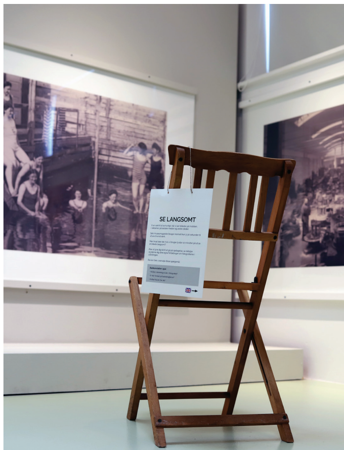
Plads til fordybelse